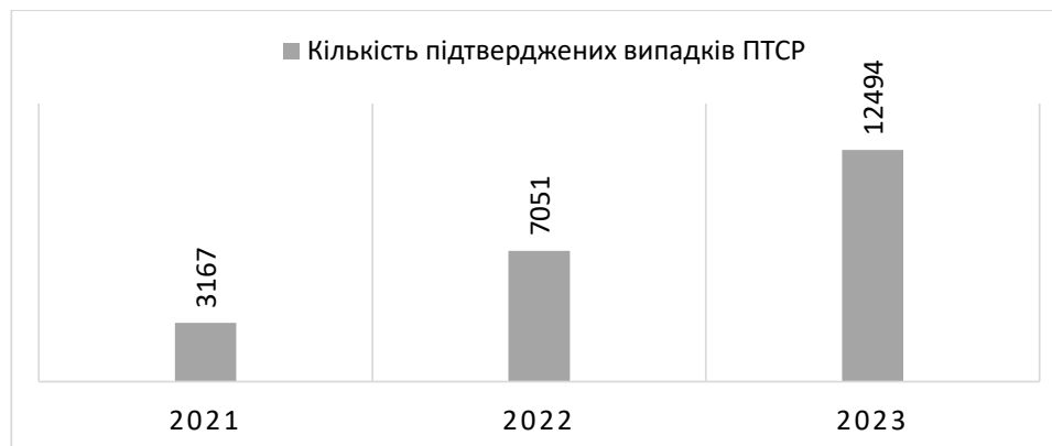
Рис. 1. Динаміка випадків посттравматичного стресового розладу в Україні

Однак не менш важливим аспектом реабілітації людей із посттравматичними розладами є відновлення духовно-особистісних орієнтирів та смислів пацієнтів. Холістичний, антропоцентричний та гуманістичний підходи в медицині та особливо у психіатрії диктують необхідність подальшого розширення цієї парадигми із включенням до неї духовного виміру. Розширення кордонів семантичного простору особистості дає змогу наповнити, скоригувати, частково сформувати ціннісний та смисловий зміст у духовне ядро людини, завдяки чому особистість вже здатна бачити орієнтири та точки опори, необхідні для відновлення. Для досягнення окресленої мети