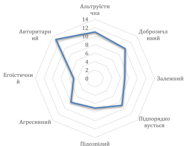
Рис. 1.3. Психограма людей, які займаються доброчинністю

У досліджуваних, які не займаються доброчинністю найбільш є вираженими октанти: егоїстичність -12 балів (з 16 можливих, високий ступінь вираженості); підозрілість -11 високий ступінь вираженості (з 16 можливих).