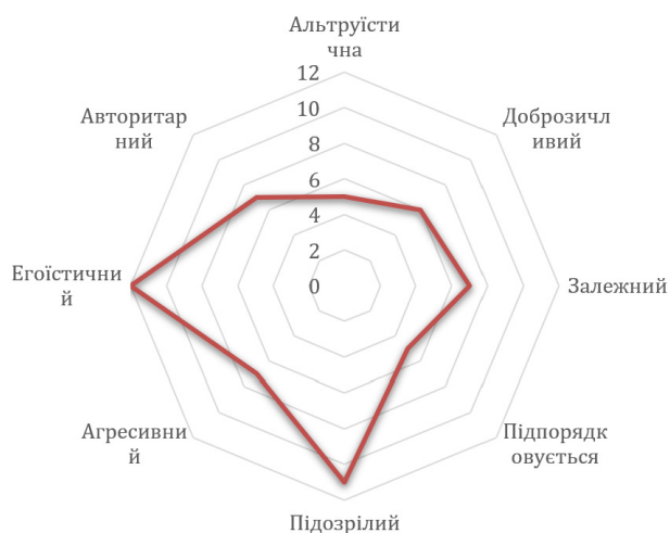
Рис. 1.4. Психограма людей, які не займаються доброчинністю

Отримані дані свідчать про те, що досліджуваним, які не займаються доброчинністю притаманні егоїстичні риси, орієнтація на себе, схильність до суперництва. Відчуває труднощі в налагоджені контакти, що може відбиватись на низькій соціальній активності, боязнь поганого ставлення, замкнутість та скептичність. Можуть виявляти прояв невербальної агресії. Появляють незалежно-домінуючий тип міжособистісних стосунків з чіткою перевагою над іншими, що можна співвіднести з самовдоволеністю (чи самозакоханість), дистантністю, егоцентричністю, виражене почуття конкурентності та прагнення зайняти особливу позицію у групі. Домінування тут меншою мірою звернене на спільні з групою інтереси і не виявляється у прагненні вести людей за собою (Рис. 1.4).